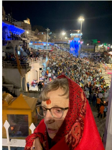
Des milliers de personnes sur le bord du Gange.