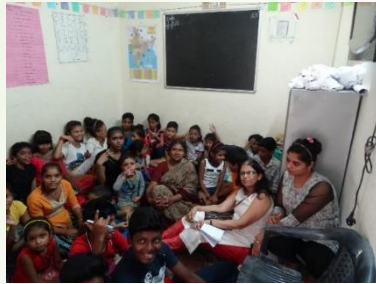
La classe du soir