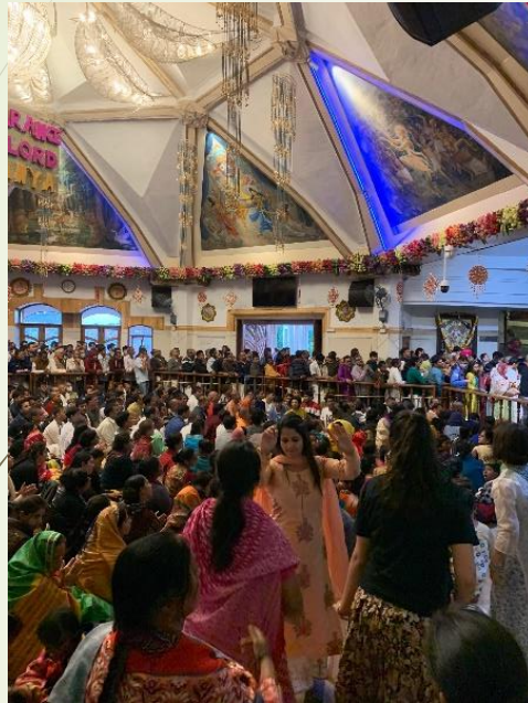
Cérémonie en l'honneur de Krishna.