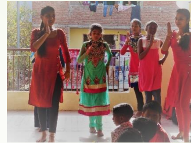
Activité : la danse