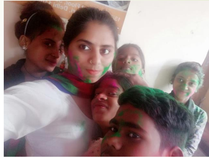
Enfants de l'association fêtant la Holi.

La Holi parfois appelée fête des couleurs est une fête hindoue célébrée vers l'équinoxe de printemps. La Holi est dédiée à Krishna dans le nord de l'Inde et à Kâma dans le sud. Holi est l'une des célébrations les plus anciennes en Inde qui existait déjà dans l'antiquité.